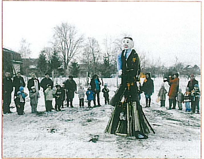
Farsang az Óvodában