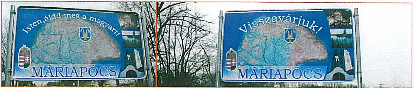
Új várostáblák a Vasút és Ófehértói út végén, a táblákat egy helyi vállalkozó ajánlotta fel