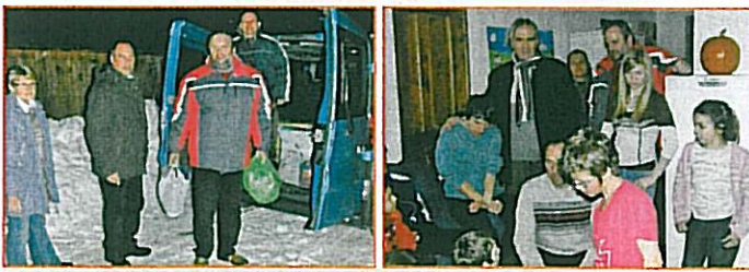
Adományok átadása Csíksomortán