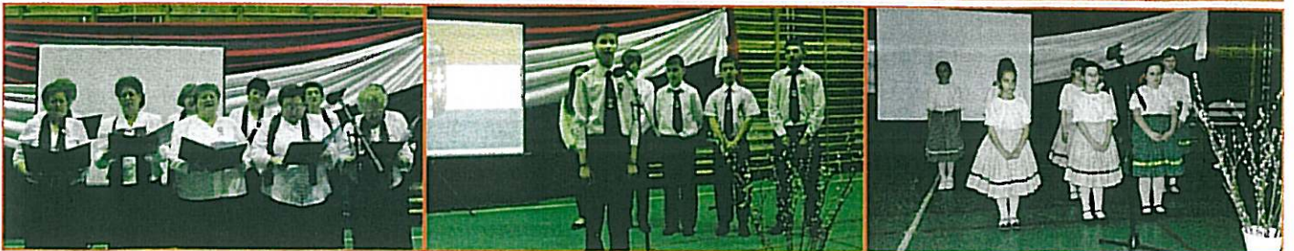
Március 15. ünnepség az iskolában