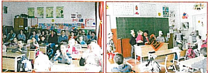
Pillanatképek az iskolában